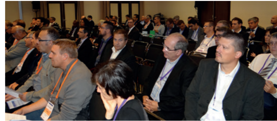
Les nombreux maîtres d'ouvrage présents ont assisté à diverses conférences sur des thèmes variés comme la démarche globale de performance, les bassins connectés, l'étanchéité des bassins...