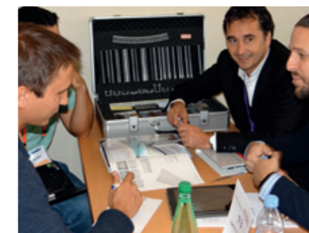
De nombreux rendez-vous ont été organisés entre partenaires et collectivités afin que ces dernières obtiennent un maximum de réponses et ainsi faire progresser leurs projets.